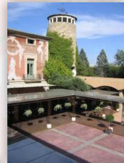
Restaurante La Masía de José Luis

Avda. Del Ángel, s/n Recinto Ferial Casa de Campo Tél.: 91 479 86 15